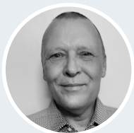
Erik Street Coaching og forretningsudvikling